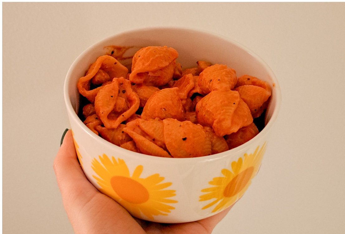
Conchiglie-pastalla tarjoiltu annos

halutessa tarjoiluun esim. fetaa, salaattijuustoa tai kasvipohjaista juustoa